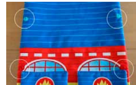
Pressions parties mâles Le dos de ces pressions ne doit pas se voir se trouvant entre les deux tissus.

7 Poser les boutons pressions sur les languettes et sur la caserne. Prenez bien le temps d'ajuster les boutons les uns en face des autres. Pour poser ceux de la caserne, passer votre main à l'intérieur.