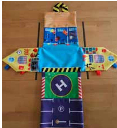
Pressions parties femelles