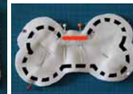
Le petit os

Surpiquer le cartable sur le tissu du dos du chien, comme ceci. →